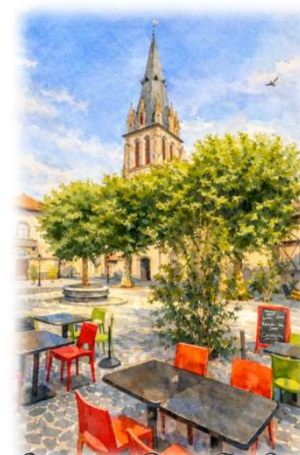
Aurillac - Place St Géraud