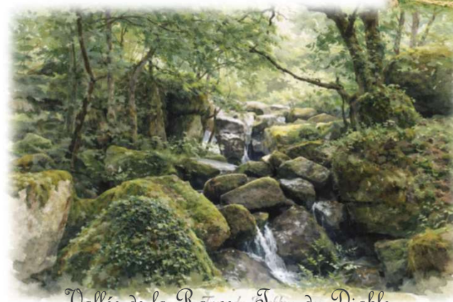
Vallée de la Rance - Trou du Diable

Route empruntée par de nombreux cyclotouristes avec un site surprenant « le trou du diable ».