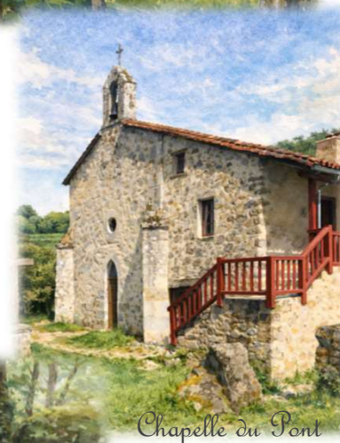
Chapelle du Pont