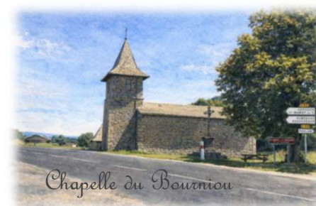
Chapelle du Bourniou